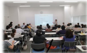
定期的に研修を実地しており高い技術の提供とサービスの向上に努めていきます。

私たちは皆様と接する時、いつもこの言葉を大切にしています。皆様と感動を共有し、皆様の生活がより豊かものとなるよう、精一杯サポートしていきます。