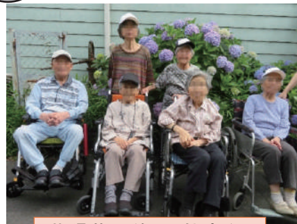
紫陽花の前で、仲良く 写真撮影

6月7日に梅雨入りして、雨が降り、紫陽花が色鮮やかになる頃になりました。デイでは、雨が降っていない午後、出来るだけ外気浴をしながら、下肢訓練も行っております。利用者様は、下肢訓練をしつつ、色とりどりの(青・水色・紫・ピンク・白など)紫陽花を見付けると、「わあ〜綺麗」「あの紫陽花、大きいわね(人の頭位)」と目も楽しまれている様子でした。その他には、梅の実が熟され、見事に実のついているのを見て「昔は梅の実を沢山お酒につけて、梅酒を作ったのよ」と言う利用者様が何人もいらっしや、懐かしまれている姿も見られています。きっと、上手に梅をつけられ、美味しく飲まれていたんだろうなあ〜と・・・