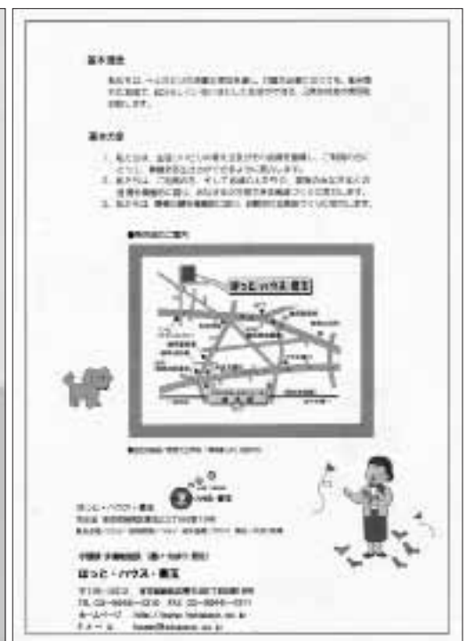
「ほっと・ハウス・豊玉」パンフレットの表紙(右)と裏表紙